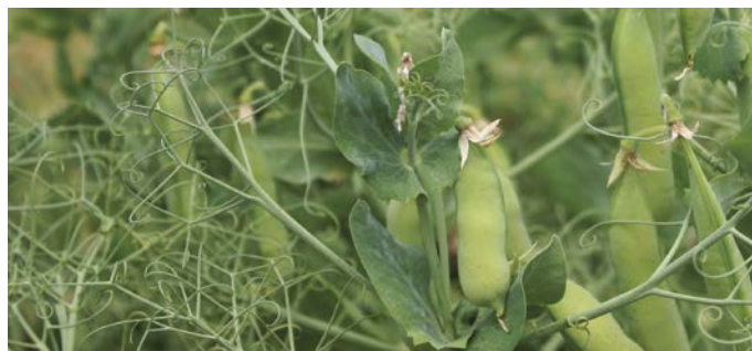
LG Aspen - vysoký výnos zelené hmoty

Pozn.: Hodnocení vlastností 9-1: 9 nejlepší, 1 nejhorší