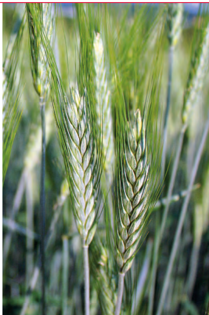
Somtri - nejpěstovanější jarní tritikale u nás

Vysvětlivky: Nízký/á ██████████ Nízký/á-střední ██████████ Střední ██████████ Vysoký/á ██████████ Velmi vysoký/á ██████████